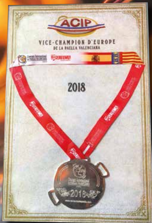
Vice-champion d'Europe de l'authentique Paella Valenciana Médaille d'argent 2018